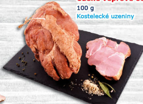
Uzené vepřové ocásky 100 g Kostecké uzeniny