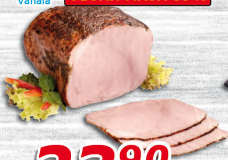
Pečený bochník 100 g Váhala