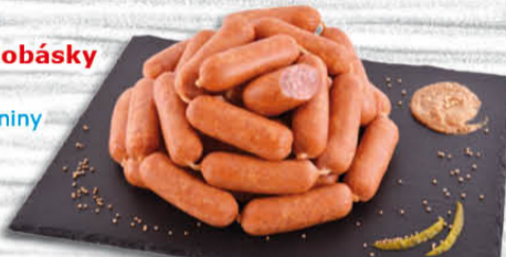
Moravské klobásky 100 g Kostecké uzeniny