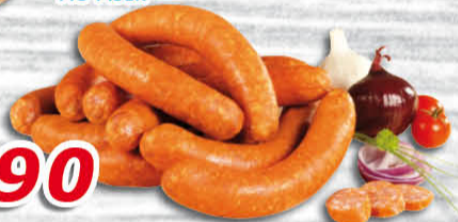
Klobása písecká 100 g MU Písek