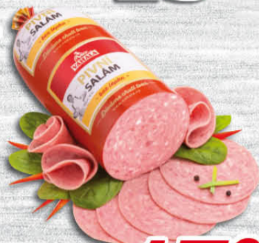
Pivní salám 100 g Váhala