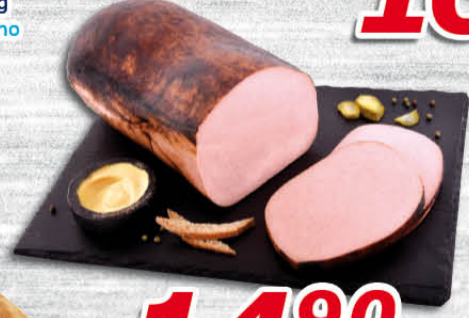
Meziříčská sekaná 100 g Krásno