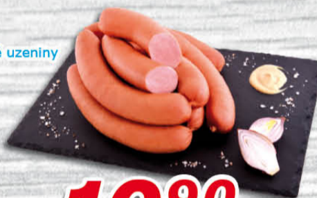
Párky 100 g Kostecké uzeniny