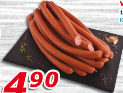
Tramská cigára 100 g Kostecké uzeniny