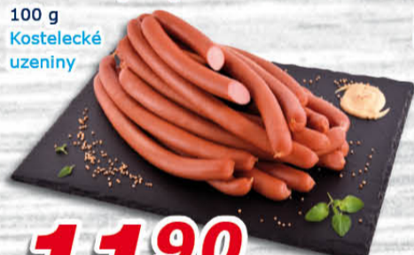
Javořické párky 100 g Kostecké uzeniny