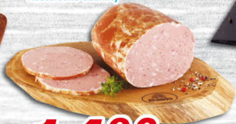
Bavorská sekaná 100 g Kostecké uzeniny