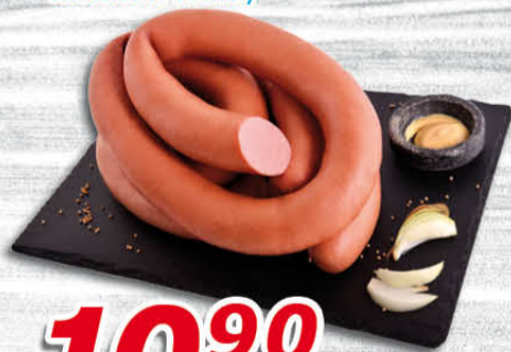
Slovenský salám 100 g Kostecké uzeniny