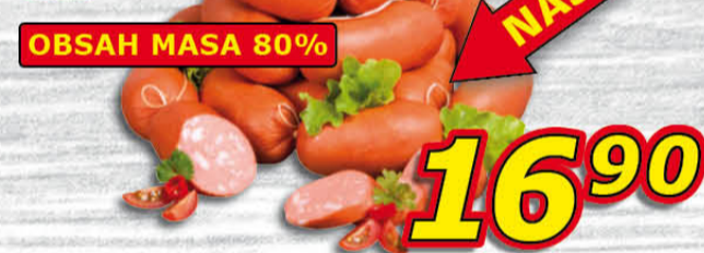
Špekáčky extra vázané 100 g Váhala