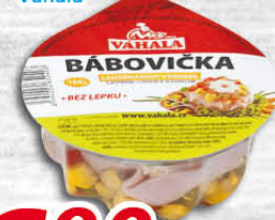
Bábovička 150 g (100 g = 17,93) Váhala