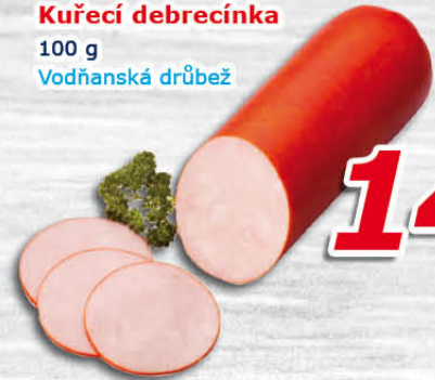
Kuřecí debrecínka 100 g Vodňanská drůbež