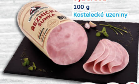
Řeznická šunka výběrová 100 g Kostecké uzeniny