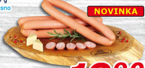
Vídeňské párky se sýrem 100 g Krásno