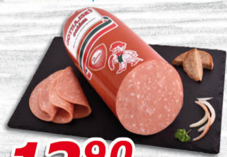
Gothajský salám 100 g Kostecké uzeniny