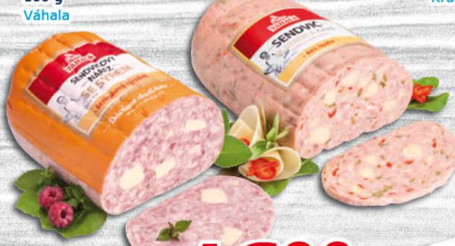
Sendvičový nářez se sýrem, Sendvič se sýrem a kápií 100 g Váhala