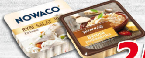
Nowaco Rybí salát Exclusive, Delimax Sýrová pomazánka Varmuža 150 g; 135 g (100 g = 17,27; 19,19)