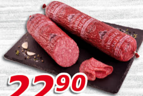
Turistický trvanlivý salám 100 g Kostecké uzeniny