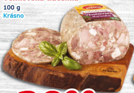
Venkovská tlačěnka 100 g Krásno