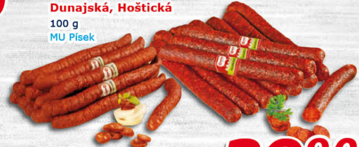
Klobása Dunajská, Hoštická 100 g MU Písek