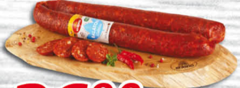
Balaton klobása 100 g Krásno