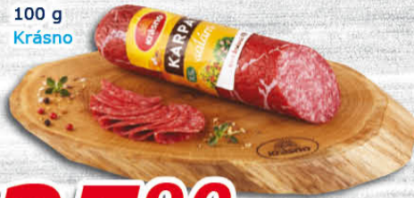
Karpat salám 100 g Krásno