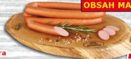
Královské párky 100 g Krásno