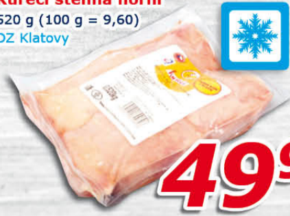
Kuřecí stehna horní 520 g (100 g = 9,60) DZ Klatovy