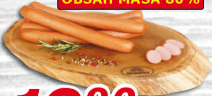
Vídeňské párky 100 g Krásno