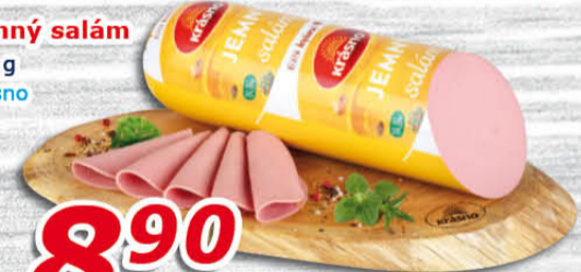
Jemný salám 100 g Krásno